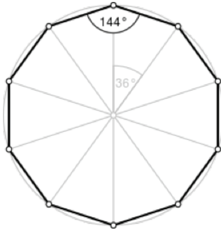
Tienhoek of decagon in geschreven in de cirkel

Maar de geometrische symboliek gaat nog verder, de lengte van de korte zijdes van de kerk is namelijk bepaald met behulp van een basiscirkel waarin een tienhoek, een decagon, is ingeschreven. Deze basiscirkel werd bij het bouwen van kerken altijd getrokken van uit een middelpunt (waar later het altaar werd geplaatst), waarop dan een centrale staak werd gezet, de zogenaamde gnomon .